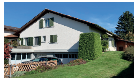
Murzelen Einfamilienhaus Bewertungsauftrag 2022