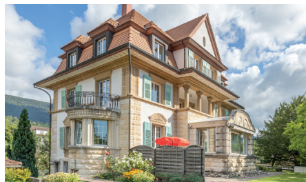
Lengnau Ehemalige Fabrikantenvilla