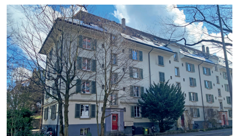
Stadt Bern Mehrfamilienhaus Bewertungsauftrag 2023