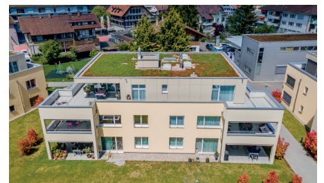
Neuenegg 5 1/2-Zimmer Attikawohnung